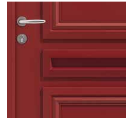
Moulures pour un relief affirmé (style Tradition).