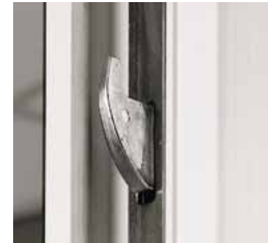
Crochets de sécurité