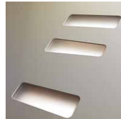
Triple vitrage Protect+ translucide pour la porte au style contemporain. Le plus esthétique.