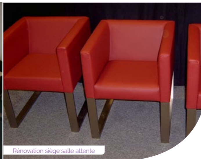
Rénovation siège salle attente