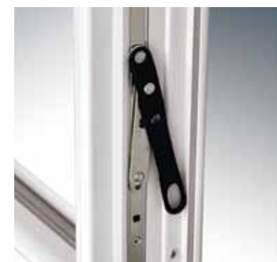
Verrouillage du semi-fixe par crémone