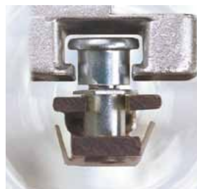
Galet à tête champignon