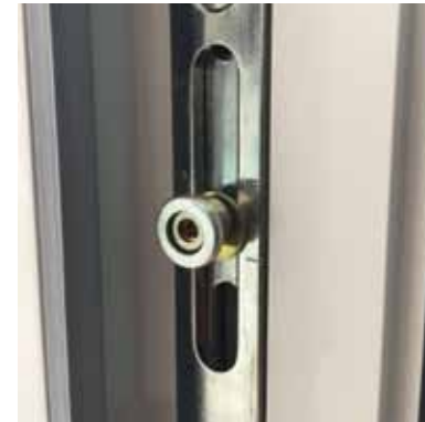
Galet de relevage